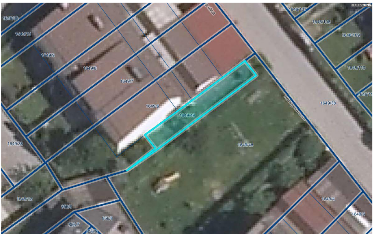
Informativna skica: nepremičnina parc. št. 1649/49, vse k.o. Trzin