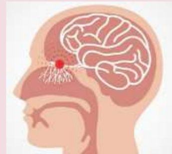
VNETJE OBNOSNIH VOTLIN