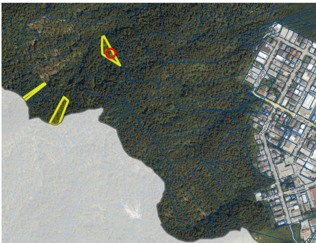
Parc. št. 555, k.o. Trzin