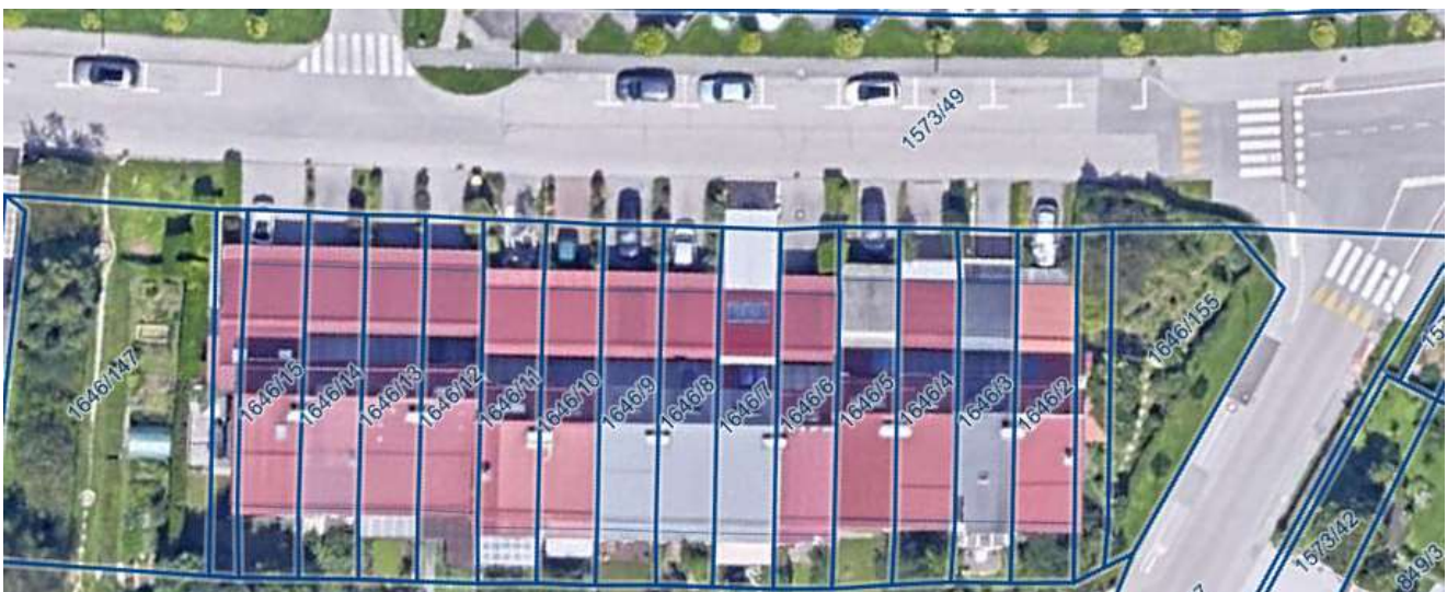
Primer dvorišč in dovozov ob Mlakarjevi ulici

V naselju realiziranih vrstnih hiš ob Mlakarjevi, Prešernovi in Reboljevi (EUP NT-18) navedeni pogoj dveh parkirnih mest na stanovanje formalno ni povsod izpolnjen, saj je lastniški del dvorišča pred garažami pri določenih nizih objektov prekratek, da bi štel za parkirno mesto. Širina dvorišč je ustrezna, globina pa variira. V praksi so dvorišča tlakovana do vozišča in je ta pogoj izpolnjen, formalno pa tlakovanje pogosto seže v območje cestnega zemljišča - konkretno gre za območje dovozov oz. priključkov na javno cesto, ki so del javne ceste in v lasti občine.