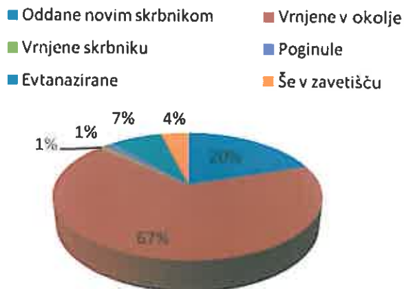
Slika 3: Mačke, oskrbljene v Zavetišču Horjul, v letu 2012